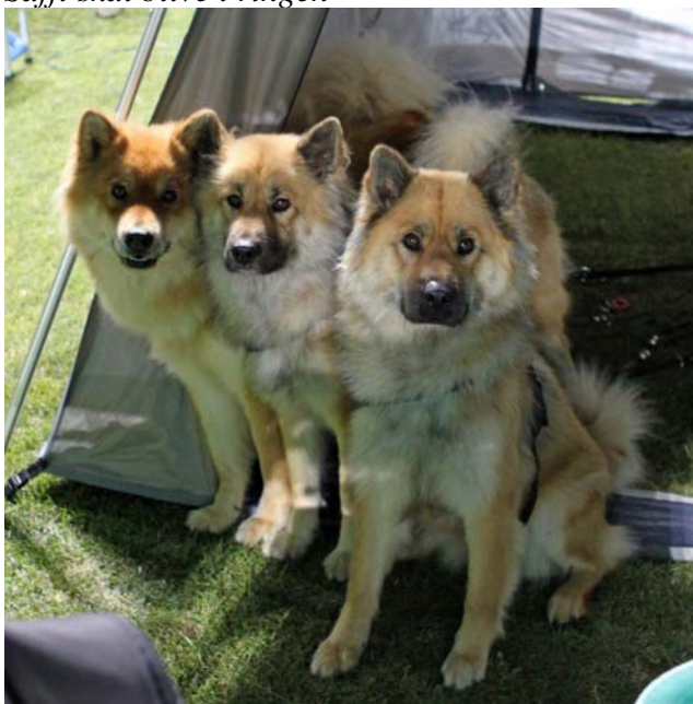
3 Skovagergaard piger!