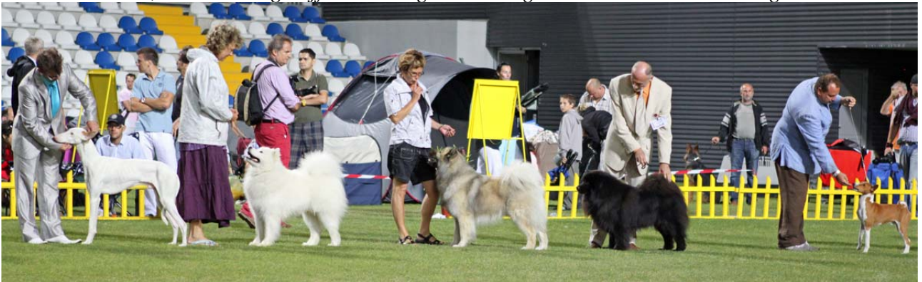
Bosse i stor ring!