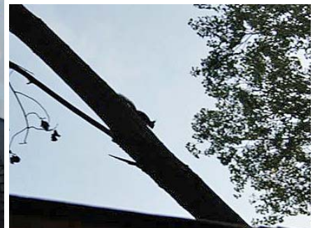
Et at de forbandede egeren, der drillede hundene!