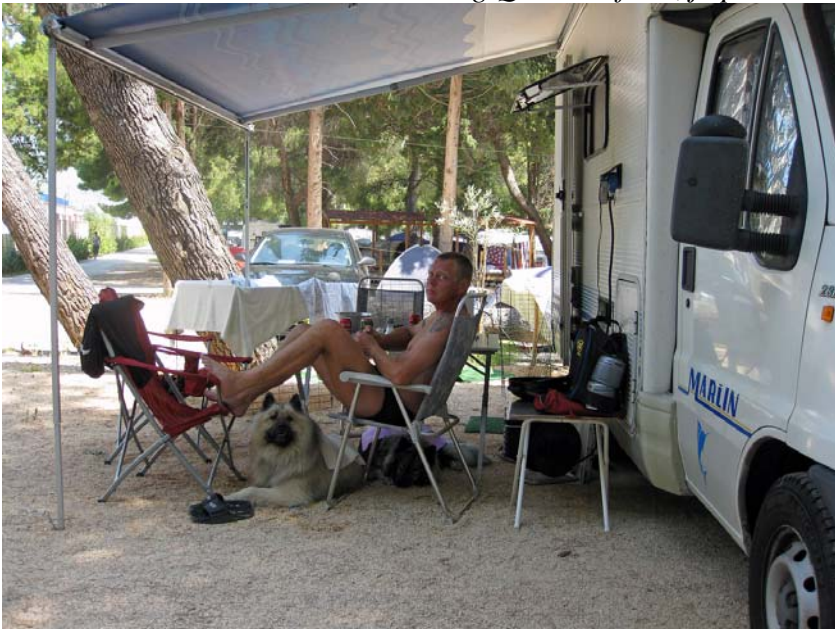
Vores lille ferie paradys!