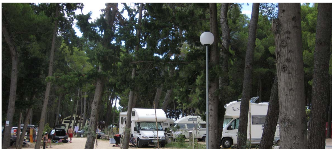
Campingpladsen i Split