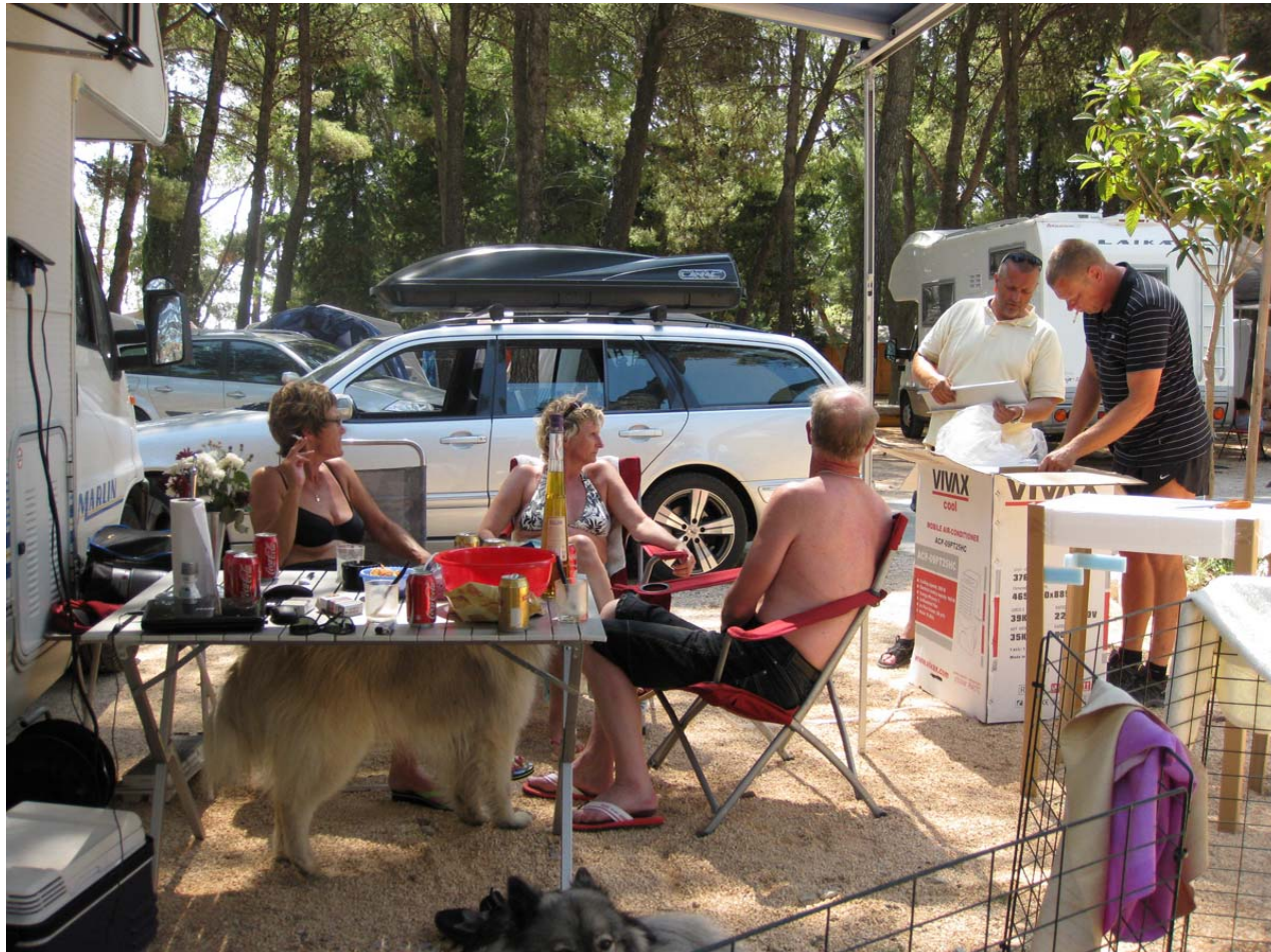
Endelig kom drengene hjem med en aircondition til mig!

Lu og Legarth havde 2 nye championer med, Basco og Asta var blevet Montenegrinske Champ, det blev fejret med champagne om aftenen. Et stort tillykke med dem.