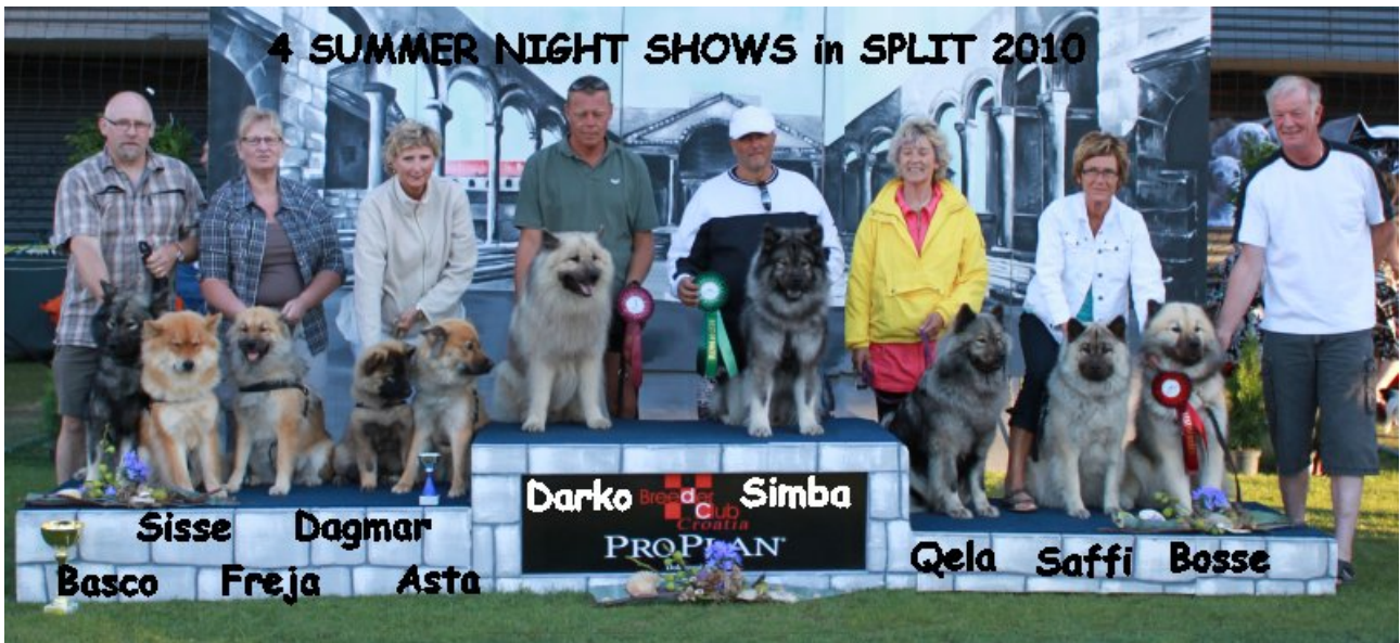
Den Danske flok!