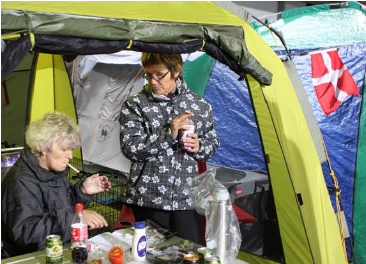
Når det er koldt, skal der noget kaffe og tobak til!