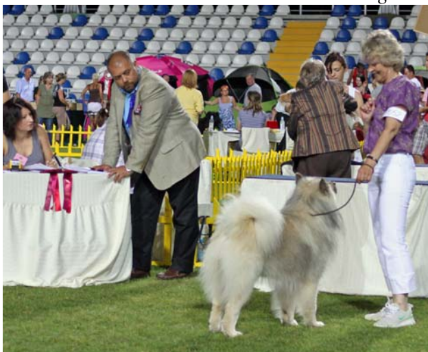
Darko er "på"!