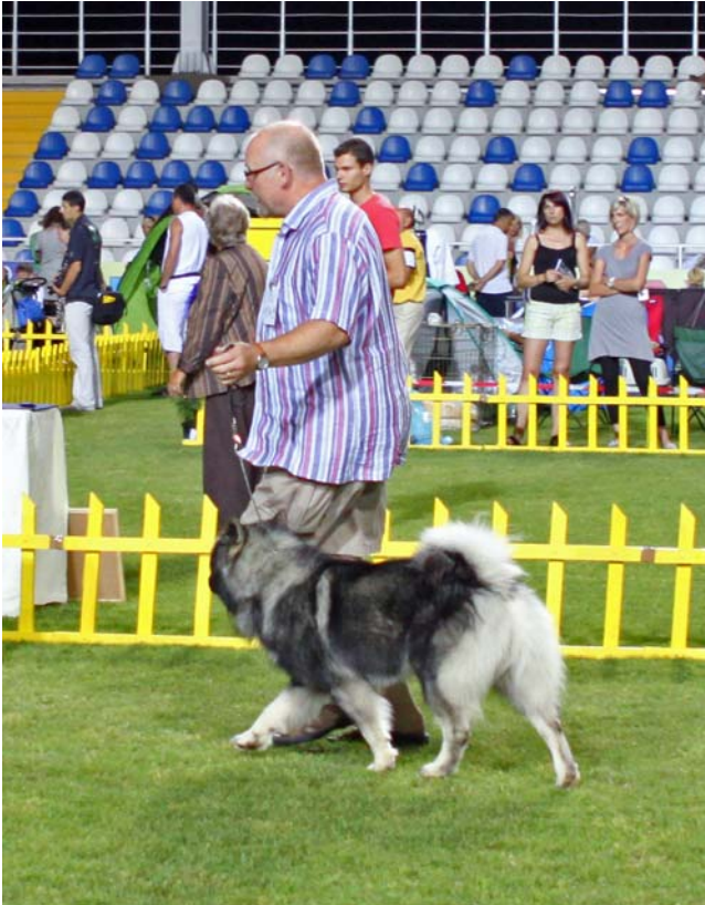
Legarth og Basco!