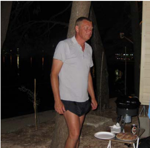
Mester grill kokken!