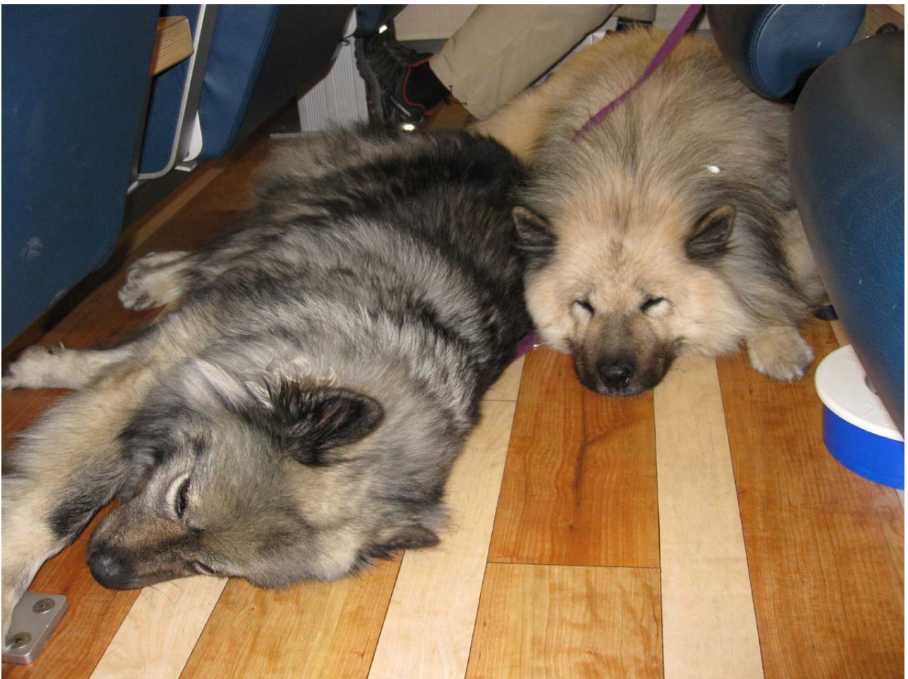
Ombord på båden til Bornholm! Nu skal vi hjem!