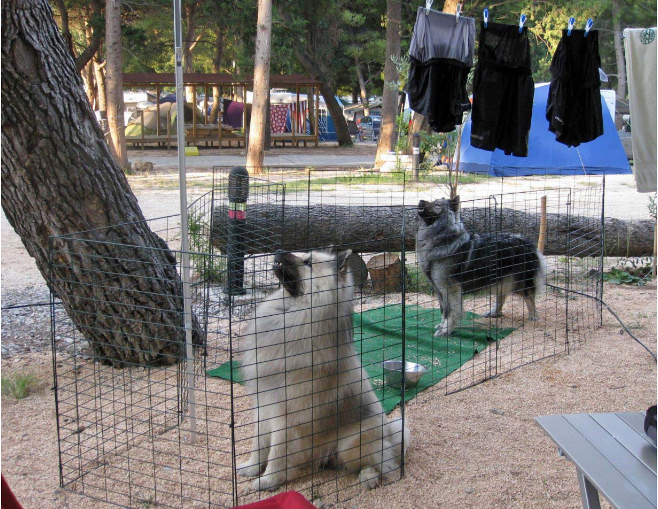
Darko og Qela har fået øje på de 2 egeren!