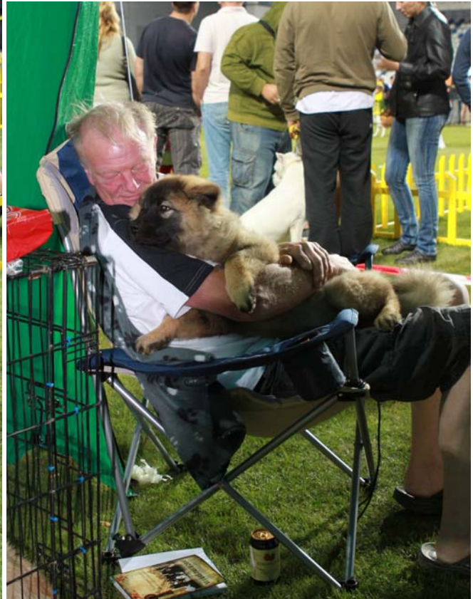
Det er ikke nemt, når Bosse og Saffi skal i ringen samtidig!