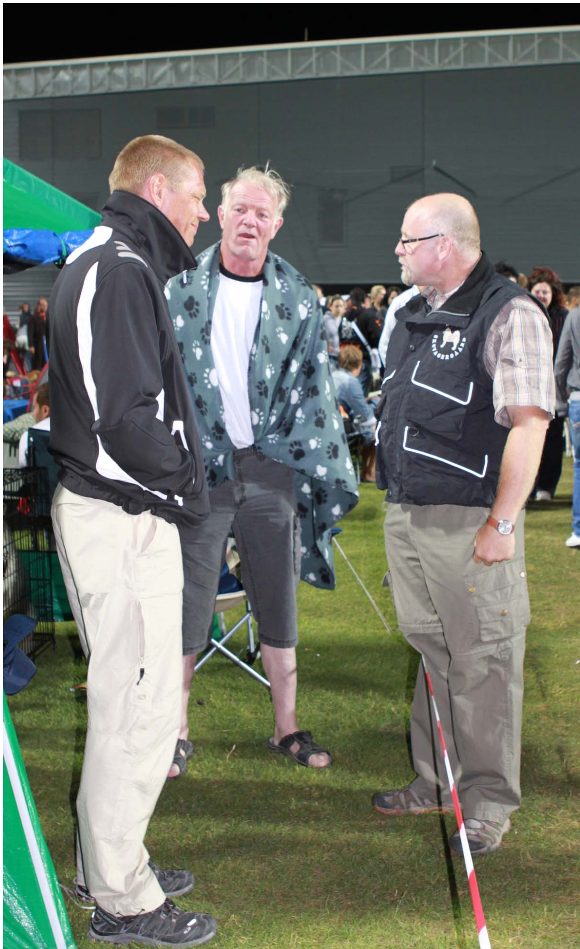
3 kloge mænd, søndag nat – gu' ved hvad de taler om?