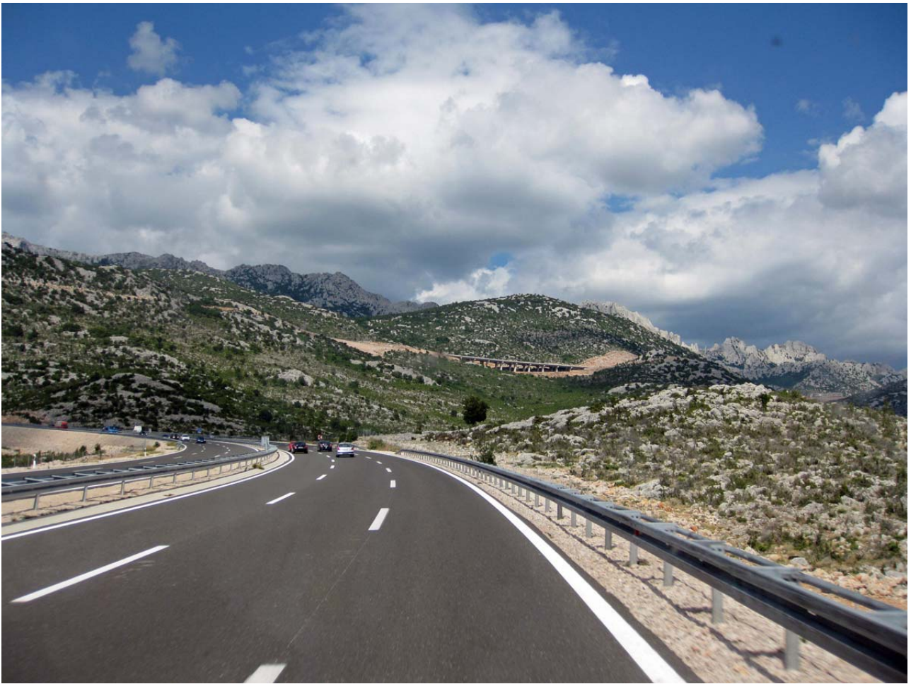
Kroatien - smukt