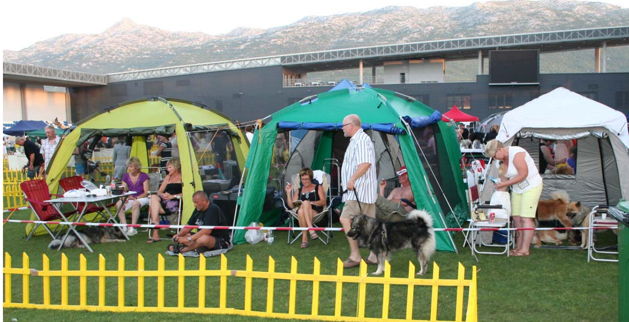
Den danske lejer om fredagen!

Vi kom hjem kl. 2.30 og kom til køjs kl. 3.30. Vi sov som en sten til næste morgen.