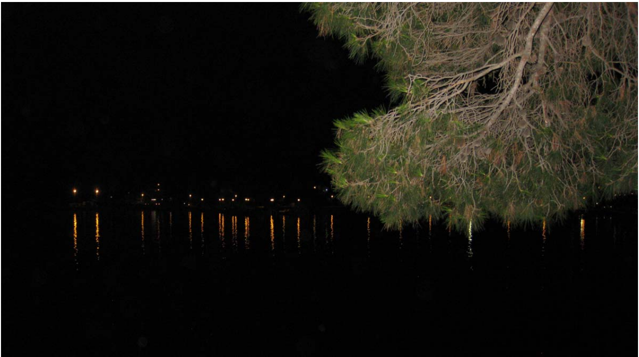
Udsigten fra Mette og Prebens terrasse og aftenen!