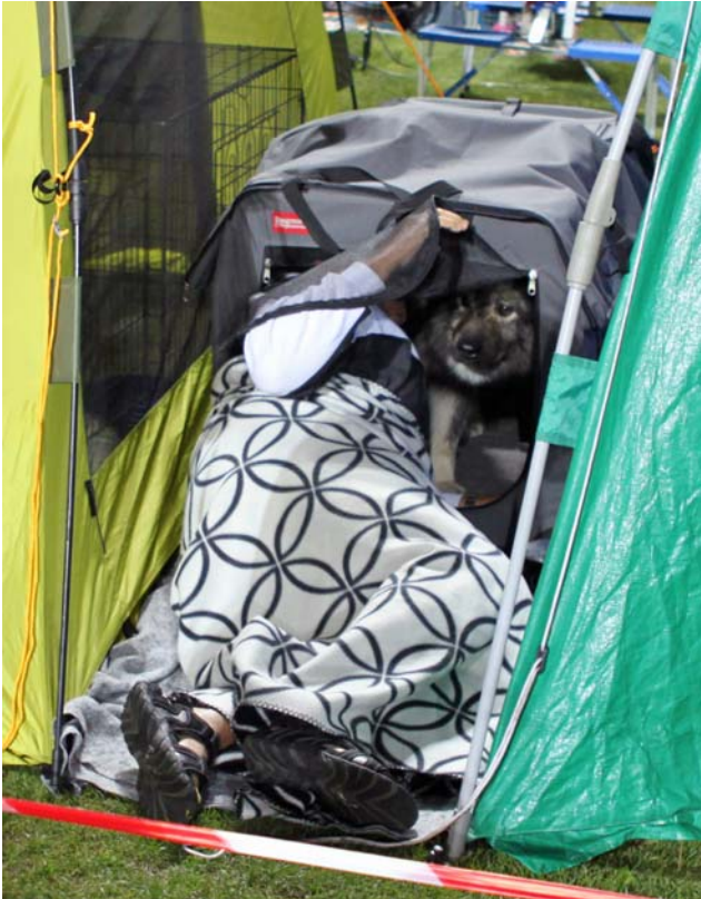
Preben og Simba får sig en mandesnæk!