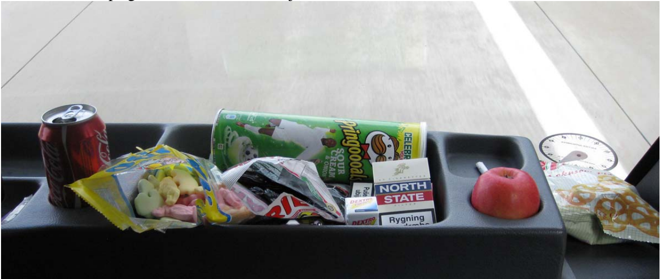
Guf til turen!

Bornholm-> Leipsig 830 km. + 3½ times sejltid