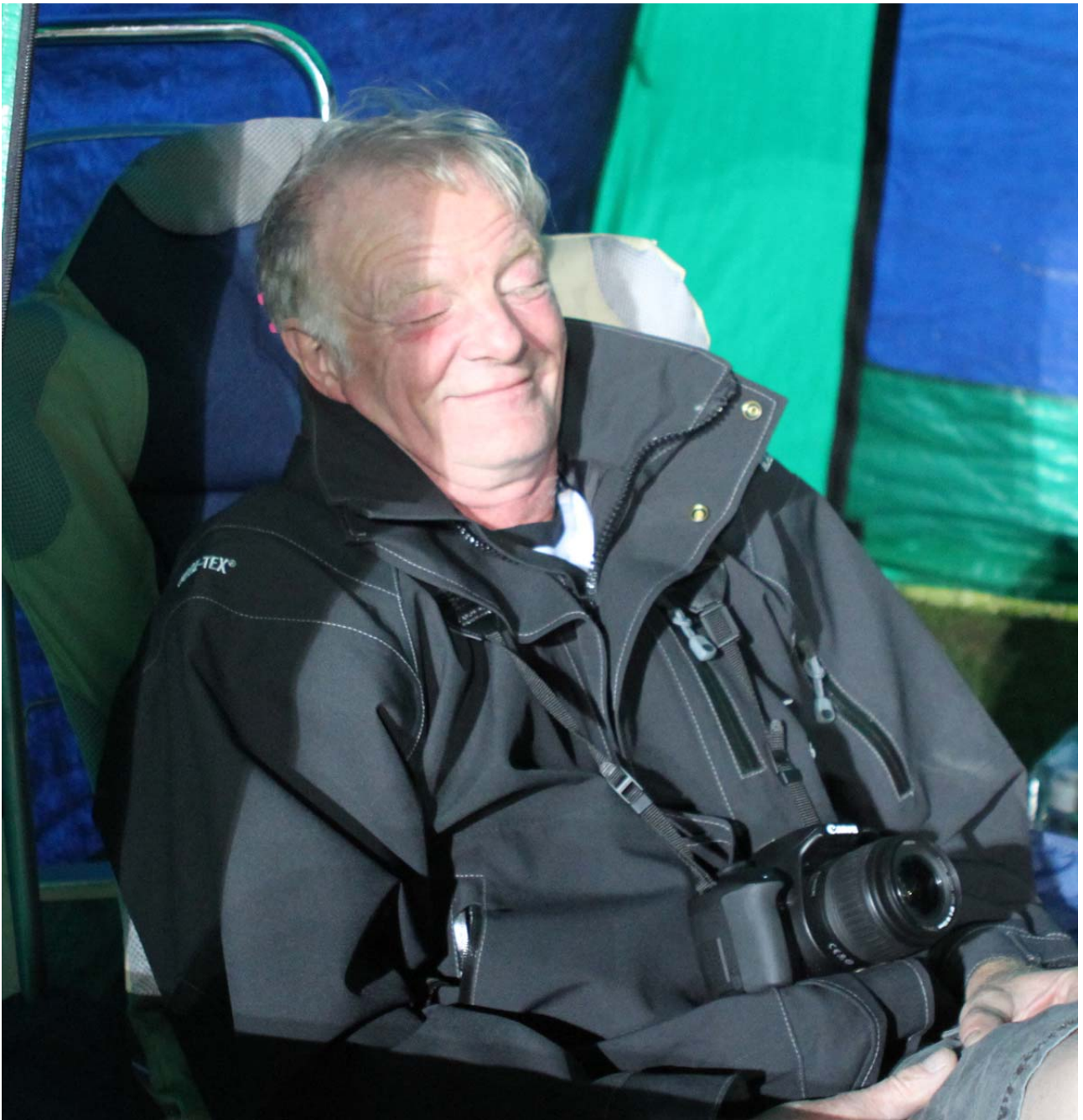
Steen! Gu' ved hvad han tænker på, med det smil på læberne?