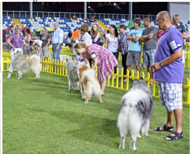
Hvem bliver BIR i dag?