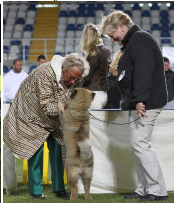
Nogen forstår at gøre indtryk på dommeren!