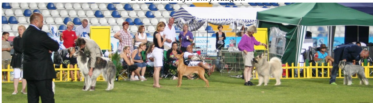
Darko i stor ring!